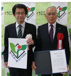
鹿児島労働局長 当法人理事長

「ユースエール認定」では、有給休暇の取得日数が平均10日以上又は年平均取得率70%以上、月平均の所定外労働時間が20時間以下かつ、月平均の法定時間外労働時間が60時間以上の正職員がゼロなど、様々な認定基準が設けられており、認定基準を満たした企業のみ厚生労働大臣より認定を受ける事ができます。