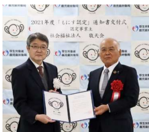
鹿児島労働局長 当法人理事長

認定事業主になるための基準として、認定基準が設けられており、障害者雇用への取り組みや成果、情報開示の項目について点数化し合計で50点中20点以上獲得することや法定雇用率以上雇用していることなどが求められています。